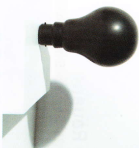
Hertz, 2014, marbre massif, 15 x 9 x 9 cm @ Sébastien Mehal

PLASTICIEN DE LA LUMIÈRE , le nom de Sébastien Mehal évoque l'image d'une ampoule électrique noire, symbole peint ou sculpté sur un socle blanc. L'opacité de cette petite fiole n'a rien d'anodin : elle évoque l'éveillement de nos regards face à son éblouissement et omniprésence dans nos villes.