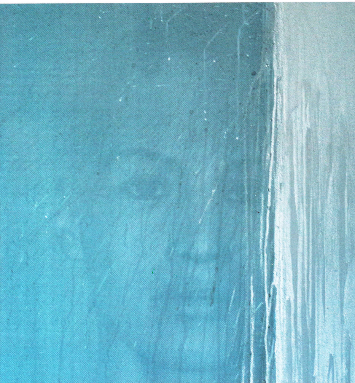
Sébastien MEHAL - Portrait #2 - 2016 - acrylique, pigments et infographie sérigraphiée sur toile - 80 x 80 cm © Sébastien Mehal